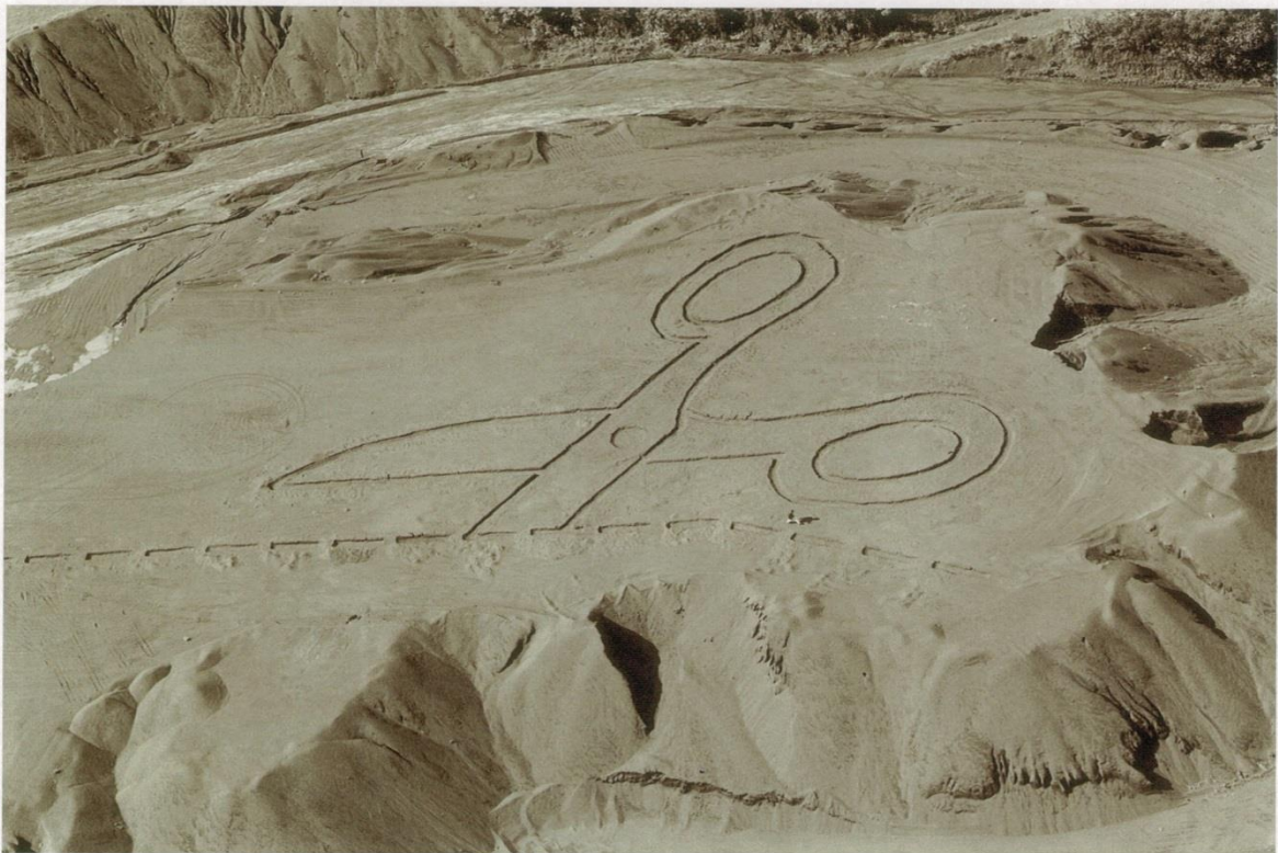
Vik Muniz Scissors, 2002

From the series "The Sarzedo Drawings (Pictures of Earthworks)"