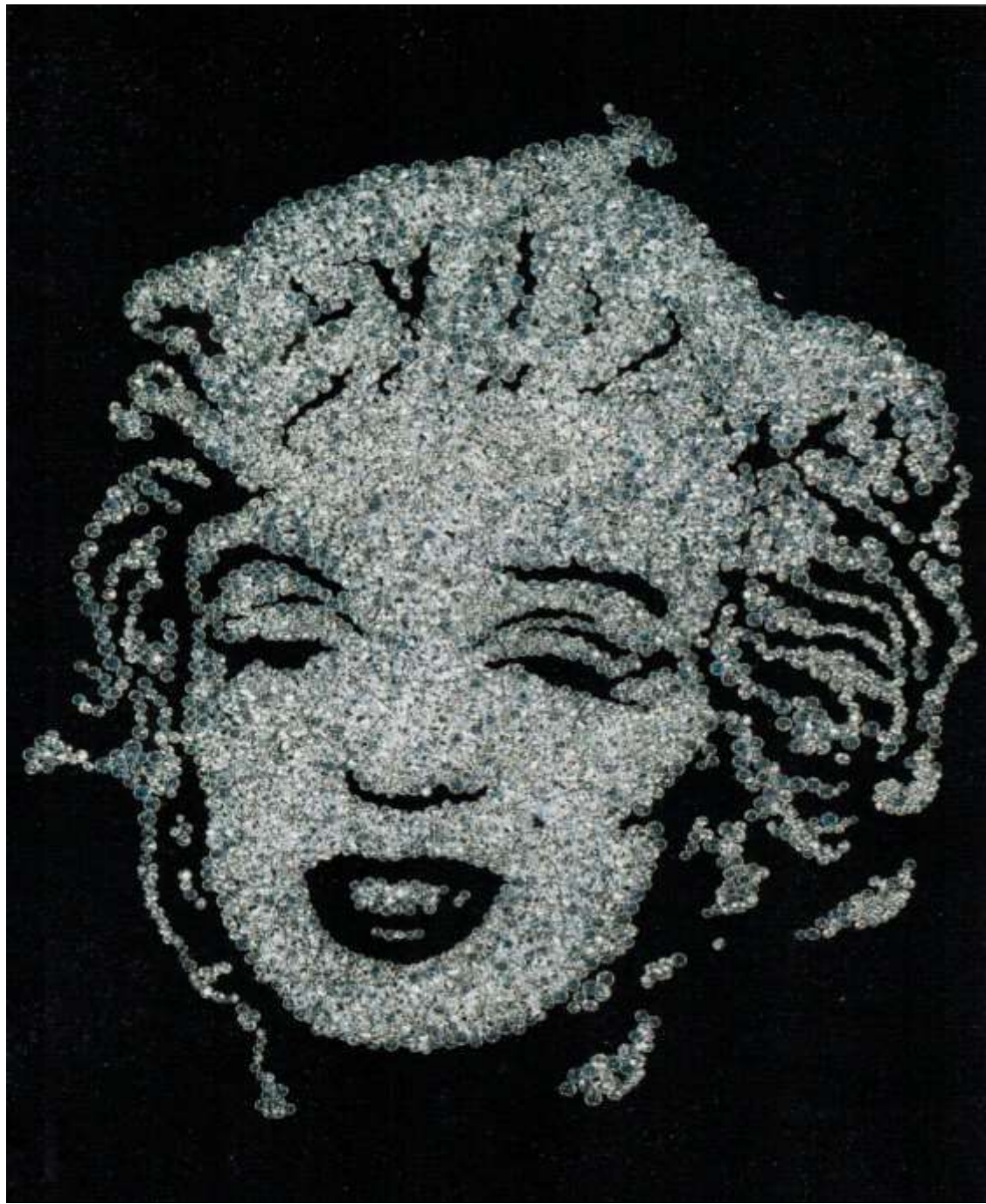
Vik Muniz Marilyn Monroe, 2004 From the series "Pictures of Diamonds"