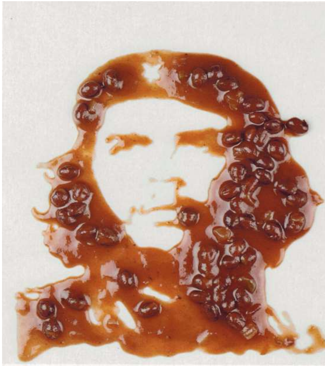
Vik Muniz Che (Black Bean Soup), 2000